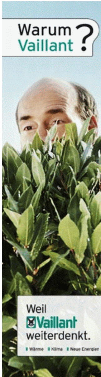
Wide Skyscraper 160x600